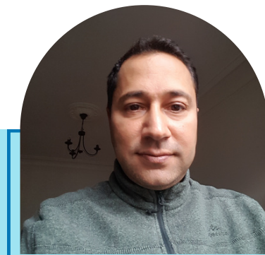
Moutaa Bouchenak Logistique